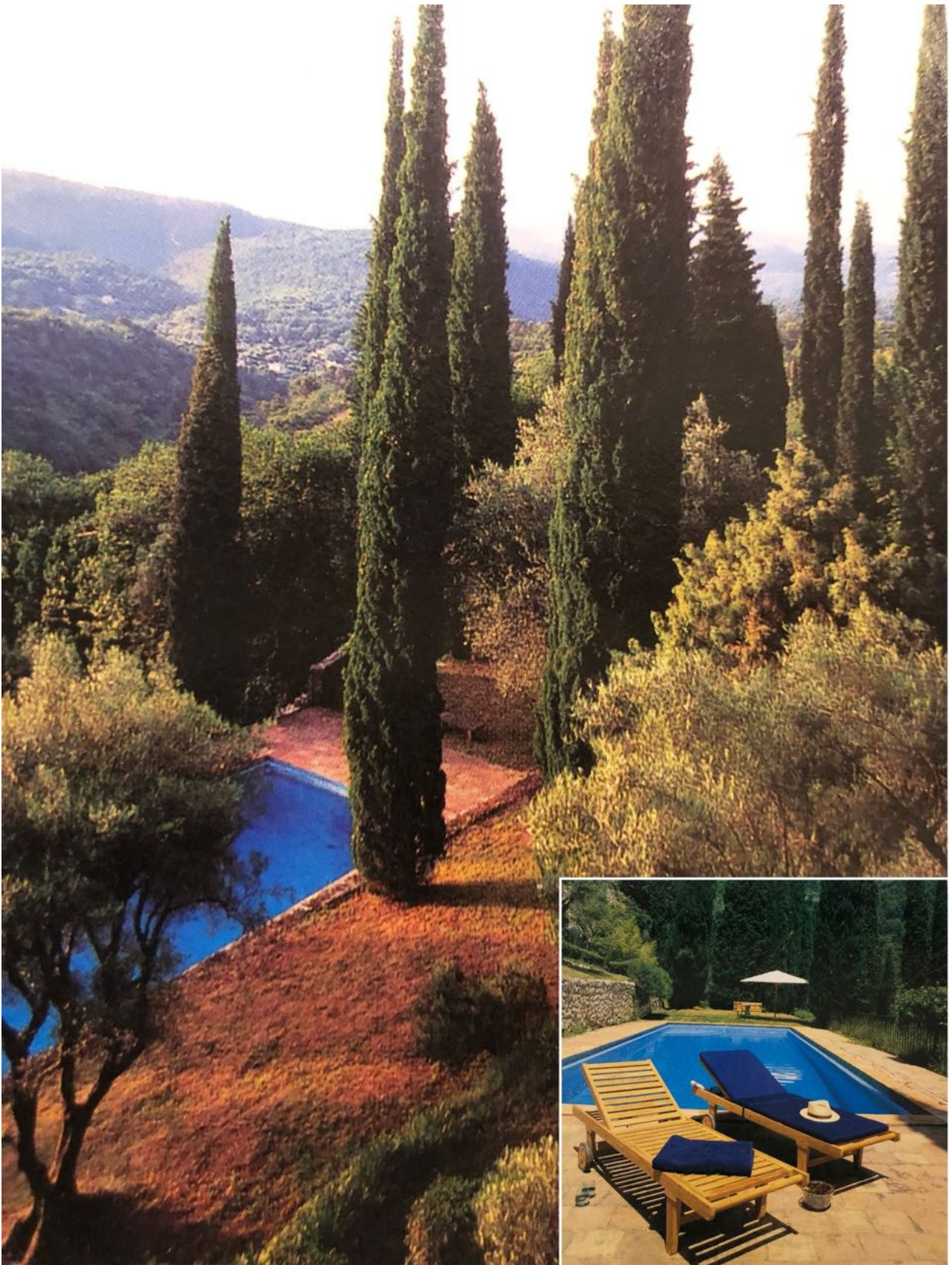
Se også billeder på Instagram https://www.instagram.com/fusagersandager